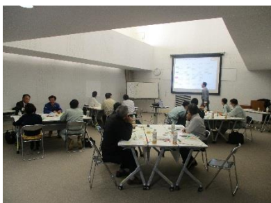
ブレインストーミングとフレームワーク (意見の発散・収束、意思決定の手法)