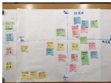
フレームワークによる意見の収束例 (意見を「実現時の効果 高・低」 「実現の 難・易」で検討・評価)