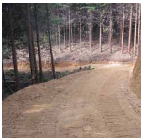
整備された作業道