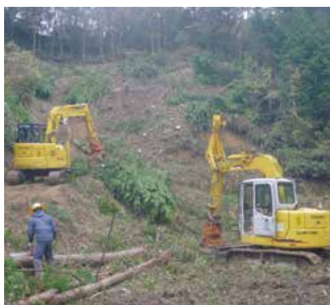
スイングヤーダによる集材