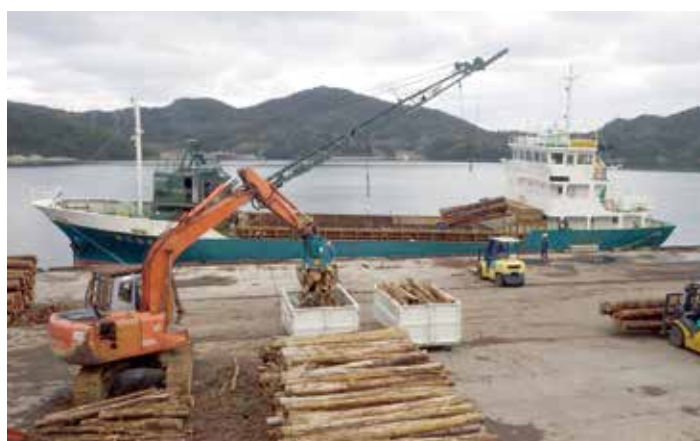
自社所有船「富栄丸」で木材を島外へ出荷の様子。林地残材も8㎡コンテナに入れてバイオ燃料として島外へ出荷