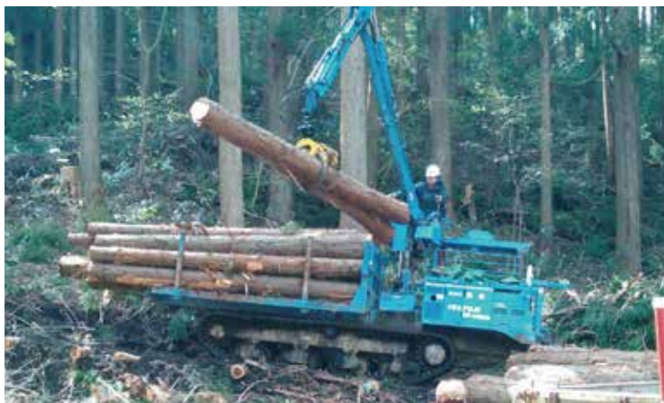
フォワーダ積込作業