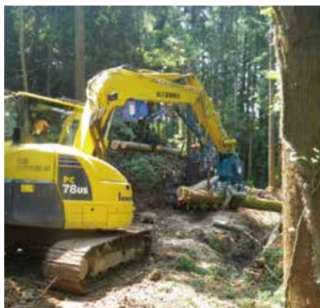
グラップルにて伐倒された材を集積

当組合は県庁所在地にあり、都市近郊という立地に加え宍道湖、中海や日本海の周辺に広がる自然環境豊かな地域で林業に取り組んでいます。今日、森林資源の活用が叫ばれているなかで、バイオマス発電用チップの供給拠点となる施設を整備したことで一層の木材生産に加え、植林、保育等の森林整備により循環型林業を構築し森林の持つ多面的機能を発揮させ緑豊かな森づくりを進めます。そうした森づくりの将来を見据えて担い手の育成にも力を入れています。