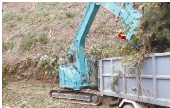
グラブによる積み込み作業