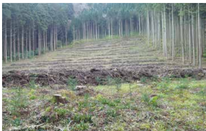
皆伐跡地に杉コンテナ苗を植林した造林地