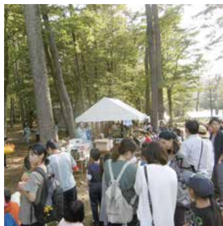
さんべ祭りにあわせて開催した林業祭