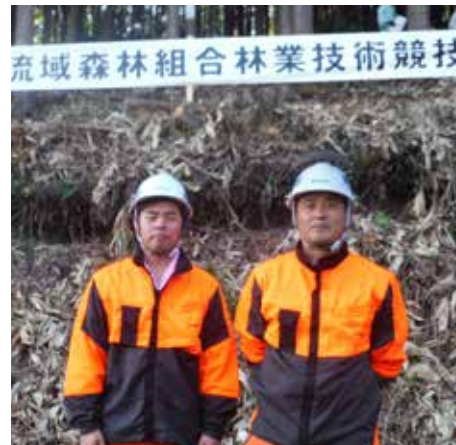
第5回(H27)林業技術競技会 準優勝