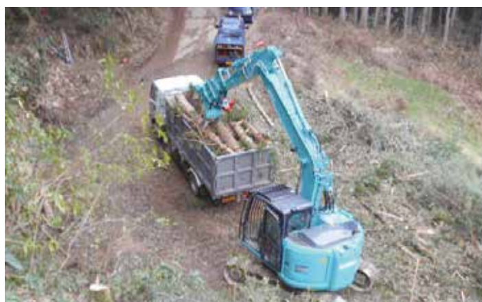
グラブによる積み込み作業