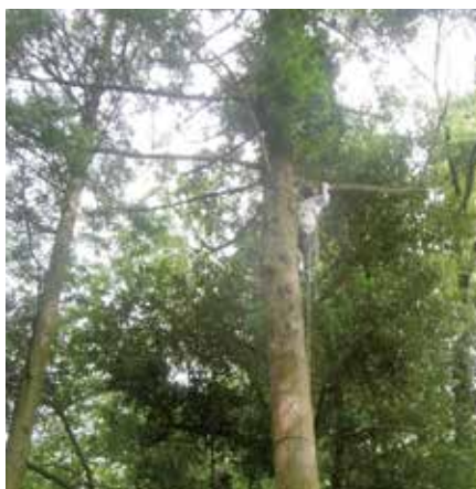
高所での伐採作業