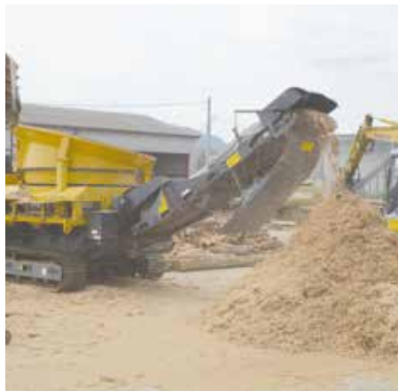
木質バイオマスチップの生産