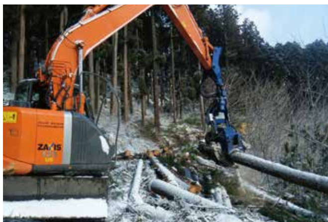
ハーベスタによる造材作業

これからも新しい時代における「未来に残すべき山林」の姿を見据えながら、山と人とのより良い未来に向かって活動を続けて参ります。