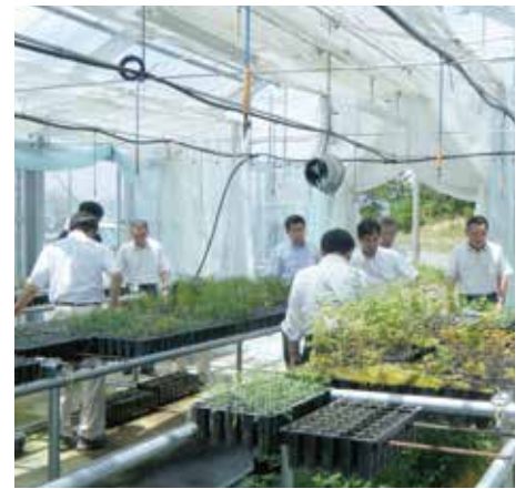
コンテナ苗の生産