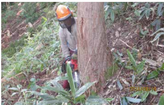
チェーンソーによる伐倒作業

事業内容は、奥出雲町、雲南市の山林を対象に皆伐による素材生産事業を行っています。建築用材を主体に合板用材、パルプ用材、燃料用材と木材をすべて利用しています。伐採跡地の更新については、森林組合と連携しながら植林を行い、「伐って、使って、植えて、育てる」循環型林業を目指して頑張っています。