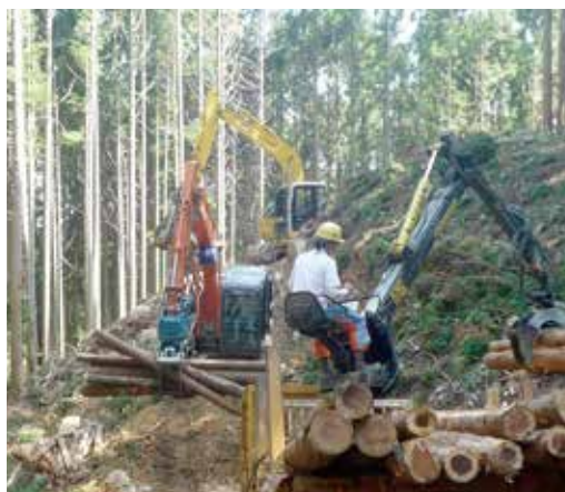
高性能林業機械を使用した利用間伐

現実には、木材価格の低迷や生産・流通体制の厳しい条件下での取り組みとなっていますが、大田市森林組合では行政を始めとした関係機関との連携を強化し、また、組合員との緊密な意思疎通や現場技術の高度化により課題解決に向けて一步一步前進しようとしています。