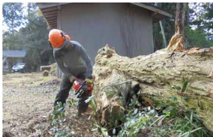
大径木の伐採作業