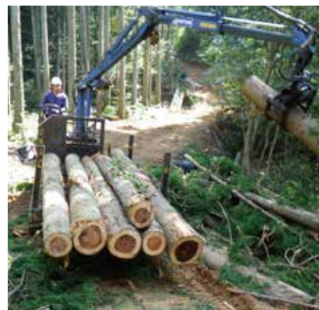
フォワーダにて集材