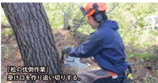
「松の伐倒作業」 受け口を作り追い切りする。