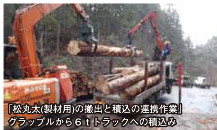
「松丸太(製材用)の搬出と積込の連携作業」 グラブから6tトラックへの積込み