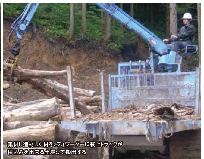
集材し造材した材を、フォワーダーに載せトラックが積込みを出来る工場まで搬出する