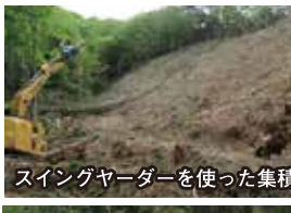
スイングヤーダを使った集積