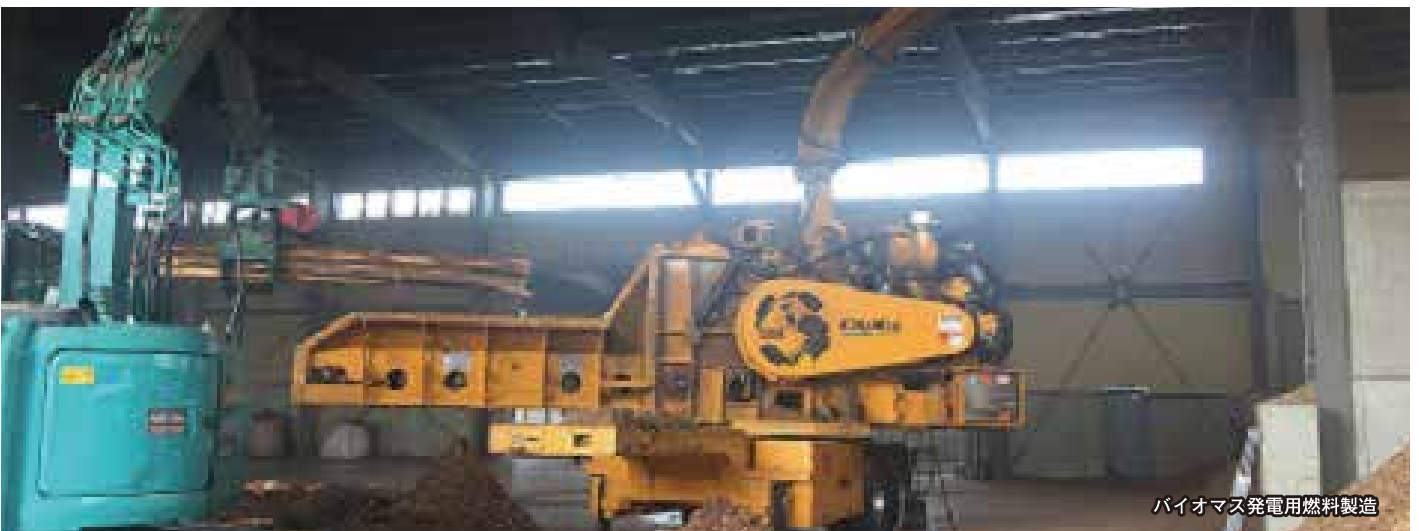
バイオマス発電用燃料製造