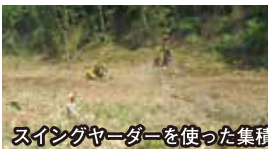
スイングヤーダを使った集積