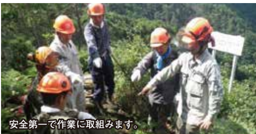
安全第一で作業に取り組みます。