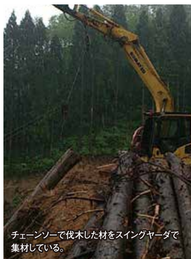
チェーンソーで伐木した材をスイングヤーダで集材している。