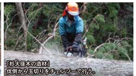
「杉大径木の造材」 伐倒から玉切りをチェーンソーで行う。