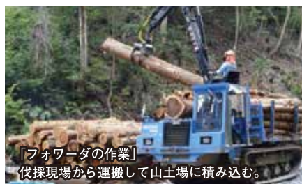
「フォワーダの作業」 伐採現場から運搬して山土場に積み込む。