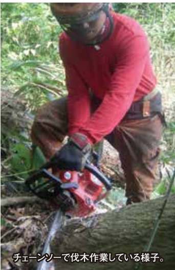
チェーンソーで伐木作業している様子。