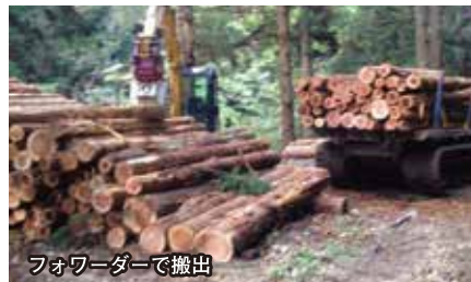
フォワーダーで搬出