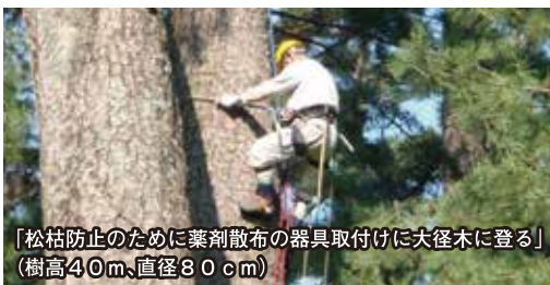
「松枯防止のために薬剤散布の器具取付けに大径木に登る」 (樹高40m、直径80cm)