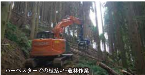
ハーベスターでの枝払い・造林作業