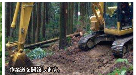
作業道を開設します。