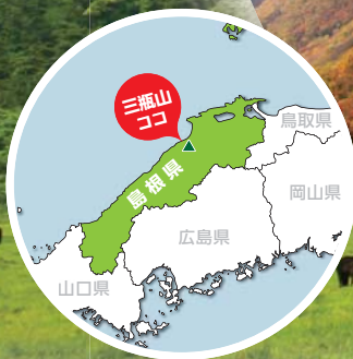
三瓶山(島根県大田市三瓶町)